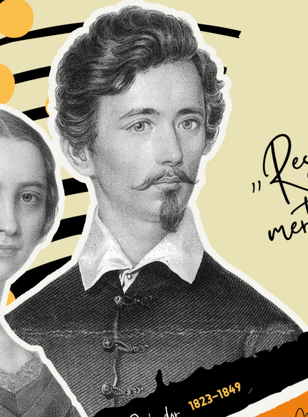
Petőfi Sándor 1823-1849