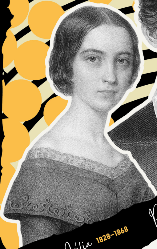
Szendrey Júlia 1828-1868

"Reszket a lelkeim, mert eszembe jutottál"